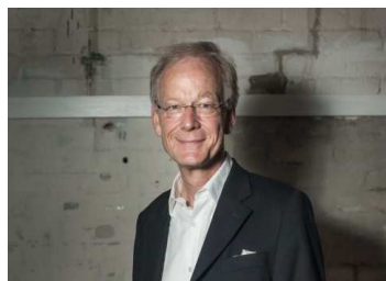
Romanzo / Roman

19 gennaio 2015, ore 17.30 / 19. Januar 2015, um 17.30 Uhr